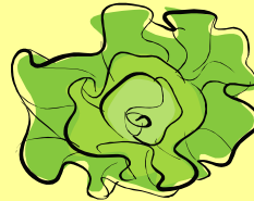
зелёный салат [zielion y j sałat]