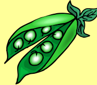
горошек [gar o szek]