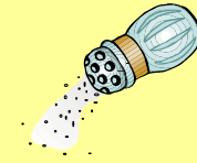
соль [s o l']