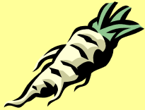
петрушка [pietrus z ka]