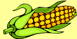
кукуруза [kukur u za]