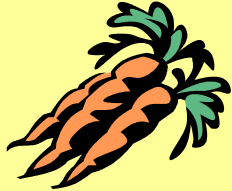
морковка [mark o wka]